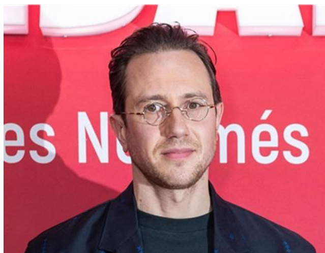
Bastien Bouillon, acteur français

Des Bastien célèbres : Bastien Bouillon (acteur français), Bastien Geiger (footballeur suisse).